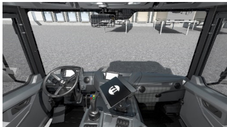
Eine umfangreiche Innenausstattung sorgt für maximale Fahrkomfort.