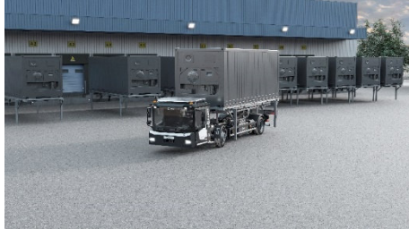
Der KAMAG PM 101 auf dem Logistikhof.