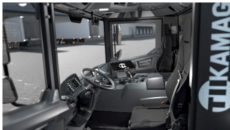
Der neue KAMAG PM 101: Kompaktes Fahrerhaus, beste Rundumsicht und optimierte Ergonomie für mehr Effizienz und Sicherheit beim Rangieren.