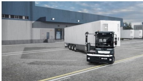
Le nouveau KAMAG PrecisionTractor 201 établit de nouvelles références en logistique de cour.

Le KAMAG PrecisionTractor 201 est le premier membre de la nouvelle famille de produits KAMAG PrecisionTractor, qui sera complétée à l'avenir par d'autres modèles. TII KAMAG met ainsi clairement l'accent sur le développement de solutions de transport de pointe qui répondent aux exigences croissantes du secteur.